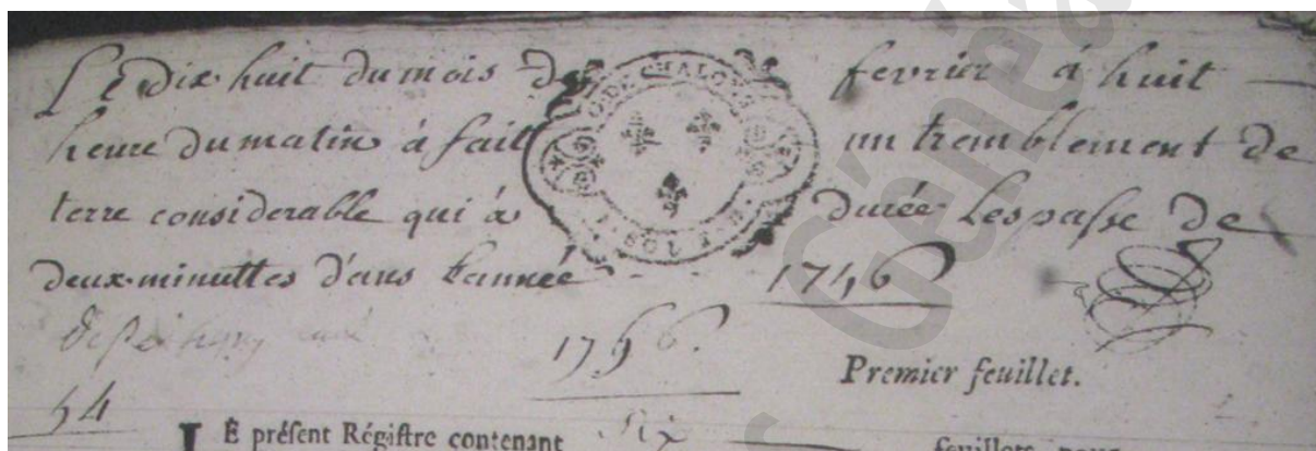
Extrait du registre paroissial de Vivier-au-Court, année 1756.

Le séisme du 18 février 1756 est également répertorié dans la base. Son épicentre se situe une nouvelle fois dans la région des Hautes Fagnes, où des dégâts massifs sont observés. L'heure du séisme, 7h45, correspond à celle que rapporte le vicaire d'Osnes (8h10). Rappelons que la mesure du temps n'avait pas à l'époque la précision à laquelle nous sommes habitués ! Selon la base de données, l'intensité a été de 5 à 5,5 sur l'échelle MSK dans les Ardennes : secousse forte provoquant des dommages légers. La base Sisfrance précise que le séisme est rapporté dans le registre paroissial de Vivier-au-Court. Cette donnée a pu être vérifiée en revenant à la source :