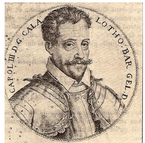
Charles III, duc de Lorraine (1545-1608).

Elevé à la Cour de France, instruit, il est le premier duc à faire dresser la carte de ses terres par Mercator. Il est très attaché au catholicisme : son duché s'attache à la contre-réforme. Il a donc pu accueillir des réfugiés catholiques et contribuer ainsi au peuplement de la Lorraine et à la mise en valeur du sol.